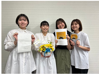
消費者教育教材資料表彰優秀賞2年連続受賞