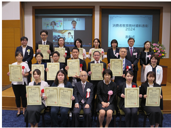
消費者教育教材資料表彰優秀賞授賞式