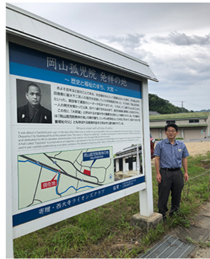
岡山孤児院発祥地

少子高齢化が進む現代社会においてさまざまな生活課題が噴出し、社会福祉政策や福祉サービスによる対応が求められています。この課題に応える前提として、社会福祉の思想や理念構造を明らかにする必要があります。そのため近代以降の日本の社会福祉の歴史を分析し、現在まで社会福祉がどのような歩みをしてきたのか明らかにしてきました。特に地域における実践や実践者の思想について研究してきました。多様化する社会福祉の将来像について実践的な視点をふまえて分析しています。歴史を通じて日本の社会福祉の特質を明らかにして、今後の展望を議論していきます。