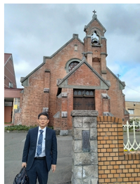
青森県弘前市の弘前昇天教会