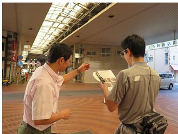
表町商店街におけるアイカメラを使った視線調査