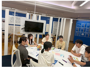
福武財団アクション助成キックオフミーティング