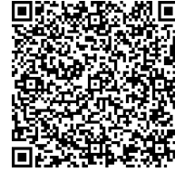
研究業績データベース