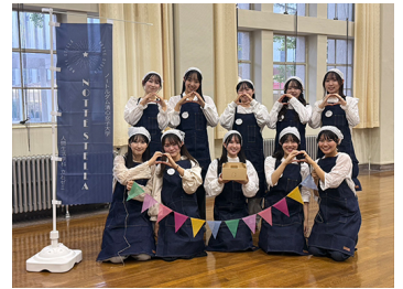
大学生主体の地域活性化プロジェクト「Notte Stella」福武財団助成事業