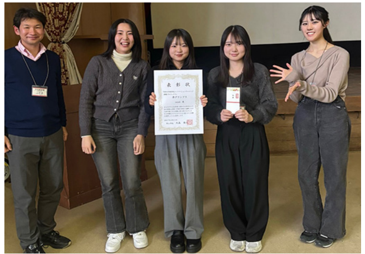
学生イノベーションチャレンジ推進プロジェクトにて準グランプリ

研究は「マルチエージェント・シミュレーションによる社会分析」を主軸とし、社会的ネットワーク、消費者行動、公共交通の3分野で展開してきました。社会的ネットワーク研究では、主体間の相互作用によりスター型構造が成立しにくいことを示し、組織内ネットワーク形成の理論的理解を深めました。地下街の消費者視線分析では、視線に関するシミュレーションを用い、空間構造の特徴と覚えられる店舗との関係を明らかにしました。さらに、公共交通利用促進研究では、高齢者の移動における路線バス・デマンドバスの併用効果を検証し、地域交通政策への応用可能性を提示しました。これらの研究は、学術的貢献に加え、地域社会への実践的還元にも資するものと考えます。