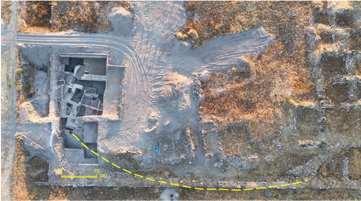
図4： 周壁のプラン予想図（点線部分）