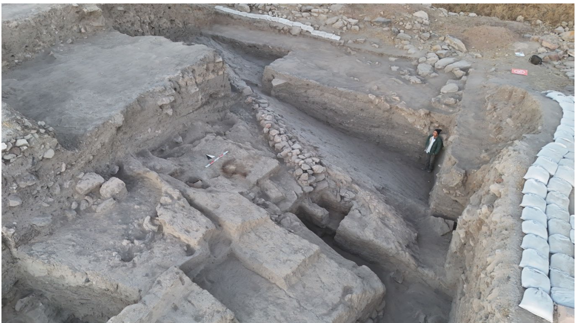
図3 周壁遺構