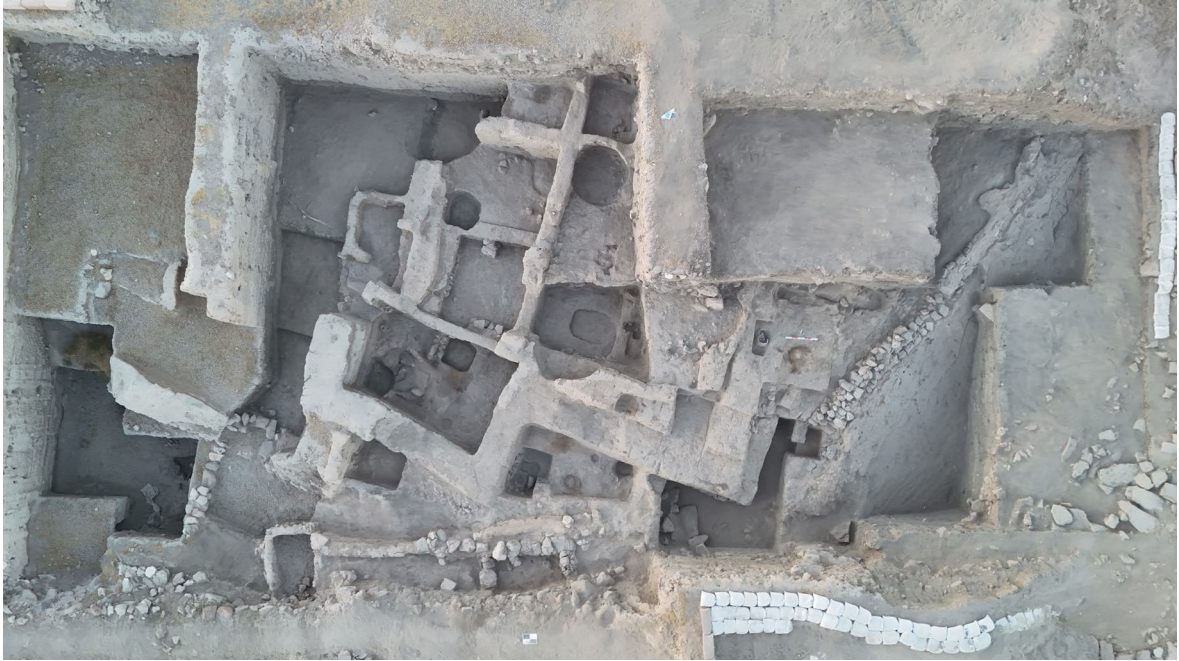
図2 約5300年前の大規模建築遺構