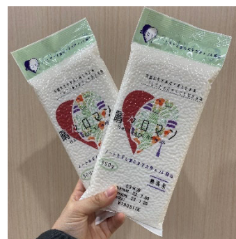
岡山のブレンド米 JA×清心共同考案「晴々ロマン」