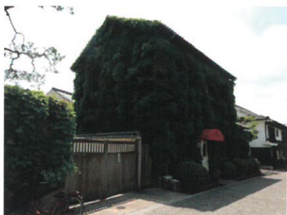
喫茶エル・グレコ 薬師寺設計