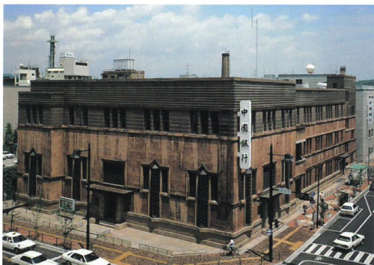
中国銀行旧本店 昭和2 (1927)年