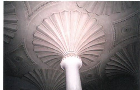
中国銀行旧本店 営業室

主催：ノートルダム清心女子大学 人間生活学部人間生活学科 生活環境学研究室 後援：総社市・総社市教育委員会・山陽新聞社・総社郷土史研究会