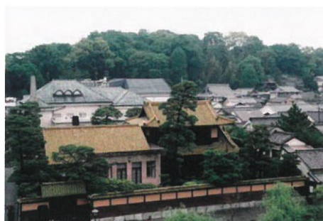
有隣荘 昭和3(1928)年 薬師寺設計