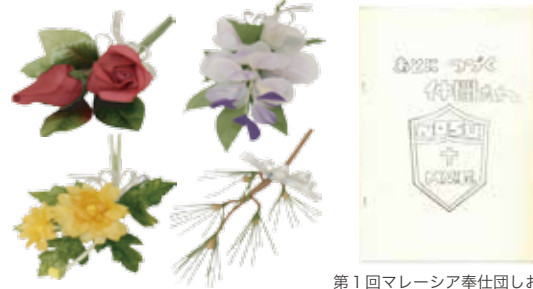
第1回マレーシア奉仕団しおり

新入生は、3月に卒業した先輩たちのクラスカラーとクラスフラワーを受け継ぐ。開学時のシスターたちは、日本の風土を大切に、色と花を選び、意味を込めた。クラスフラワーはアメリカ合衆国の姉妹校に由来。また、クラスフラワーはある卒業生の手作り。