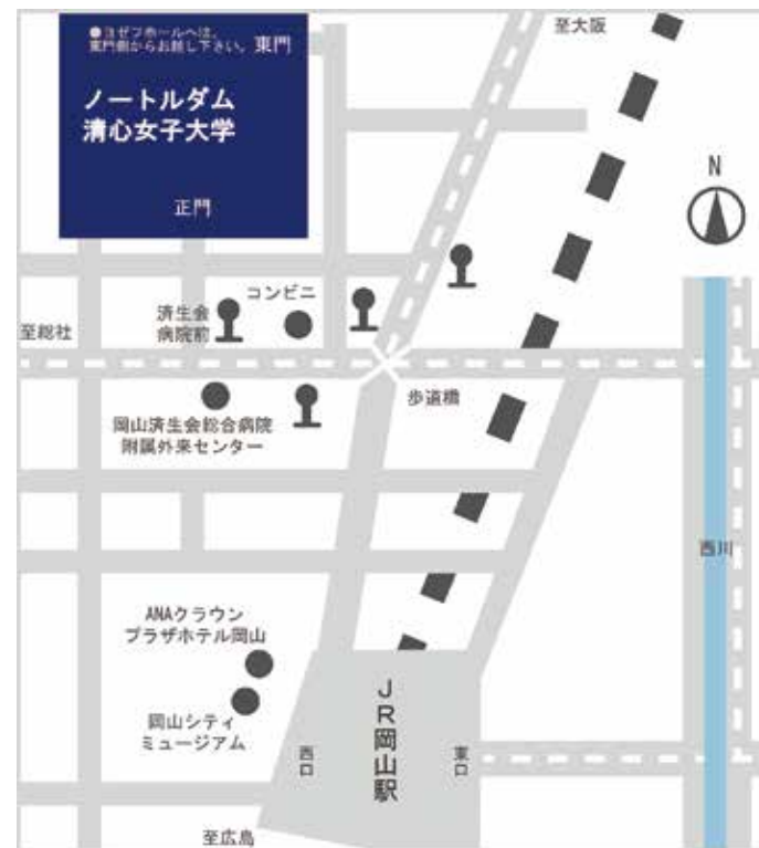
JR岡山駅(西口)から北へ、徒歩約10分

開室 9:00 - 16:00 (月~金) 9:00 - 12:00 (土) 上記以外の開室日は大学ホームページに掲載。 閉室 原則として日・祝日。 その他、本学休業日、入学試験・大学行事に伴う入構制限期間。 場所 ヨゼフホールA棟1階