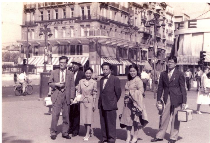
【写真3】「食事を共にした日本人留学生諸氏」

届けておいてくれないか、しばらくしたら自分もそこに行き、一緒に食事をしよう」と頼まれた。私たちは「自分の荷物で一杯だから」といって断ったが、気前よく引き受けていたら密輸の片棒を担いだ容疑で逮捕されるところであった。後にこのことが判明して冷や汗をかいたが、それやこれやのつまらない出来事は省略する。【写真3】は