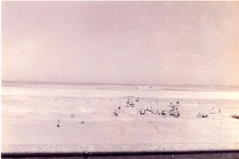
【写真1】「スエズ運河通過中：右岸」

ってひた走った。そのうちに夜になり、ベッドに入ろうかと思っている頃に「ただいまヴェスヴィオの火が見えます」というアナウンスが聞こえ、飛び出していってみると右手に遠く、たしかに火山の噴煙が望まれた。エトナの火も拝めたはずなのに、うっかりしているうちシチリア島を通過するのに気付かなかったのは、顧みれば残念なこと