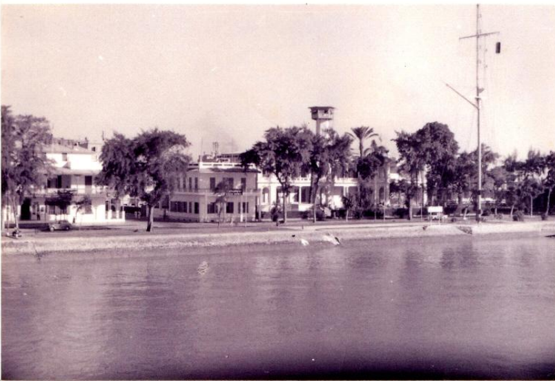
【写真2】「スエズ運河通過中：左岸」

一夜明ければ九月十九日の朝、ラオス号は無事にマルセイユに到着した。横浜を出航してちょうど一ヶ月かけての長旅であった。下船する支度をしていると顔見知りのフランス人船員がやってきて、「自分はあなたたちより下船が遅くなるので、この荷物を俺の妹のやつている海鮮レストランに